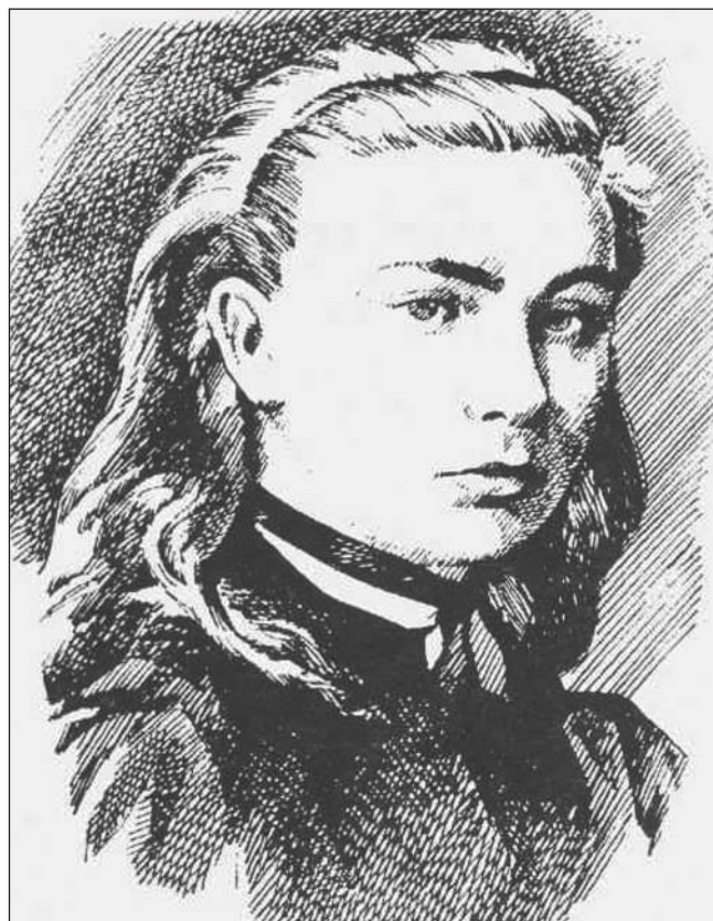
С. Ф Русова (1856—1940)

Німецька чи англійська системи освіти "серце"