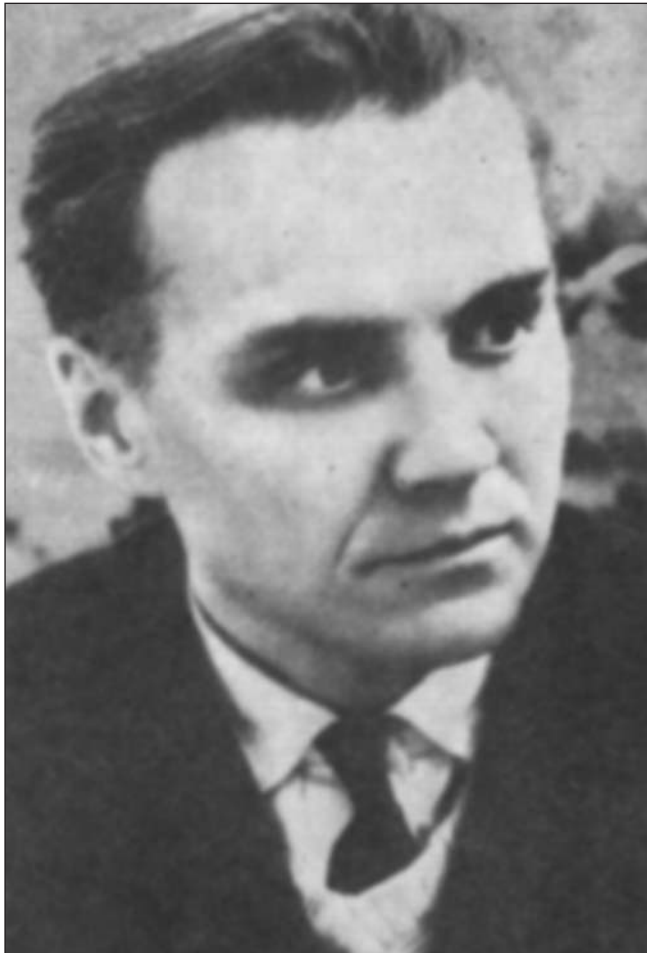
В.А. Сухомлинський (1918—1970)

(від Ф. Бекона, Г. Спенсера, Дж. Ланкастера до Дж. Локка і М. Монтессорі) більше розмірковують про формування практичних (утилітарних) навичок або "виховання джентльмена", становлення малюків за допомогою старших учнів (белл-ланкастерська система) або про практично-раціоналістичний підхід до освіти тощо. Американська педагогічна традиція орієнтує дитину на практично-прагматичне ставлення до життя; вона є педагогікою "успіху", якого дитина має добитись, що б там не сталося.