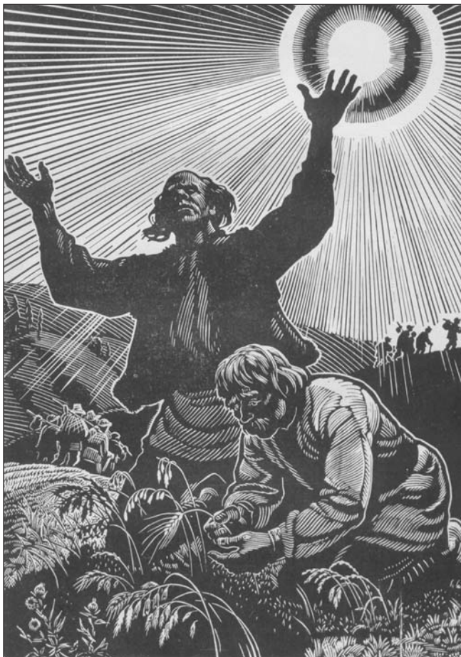
Посуха. Ілюстрація І. Принцевського до повісті "Борислав сміється". 1966 р.

реалізм", що пізніше був потрактований літературознавцями радянського періоду як прообраз соцреалізму.