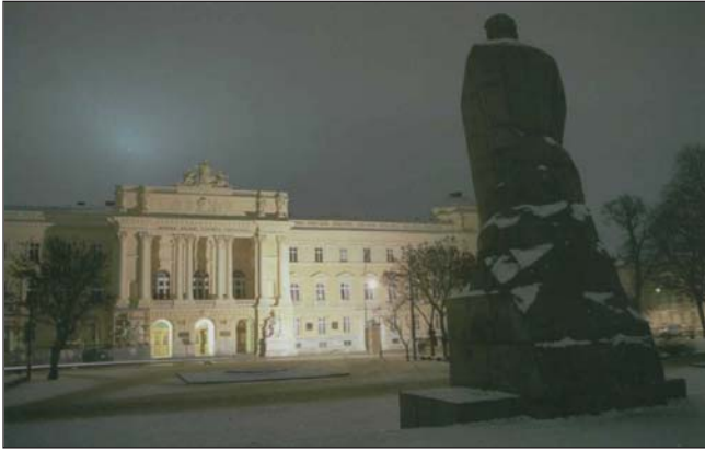
Львівський національний університет імені Івана Франка

Іван Франко — автор національного гімну "Не пора" (1881). За життя видав 60 збірок власних художніх творів. Збірку поезій "З вершин і низин" (1887) сучасники вважали другим українським "Кобзарем".