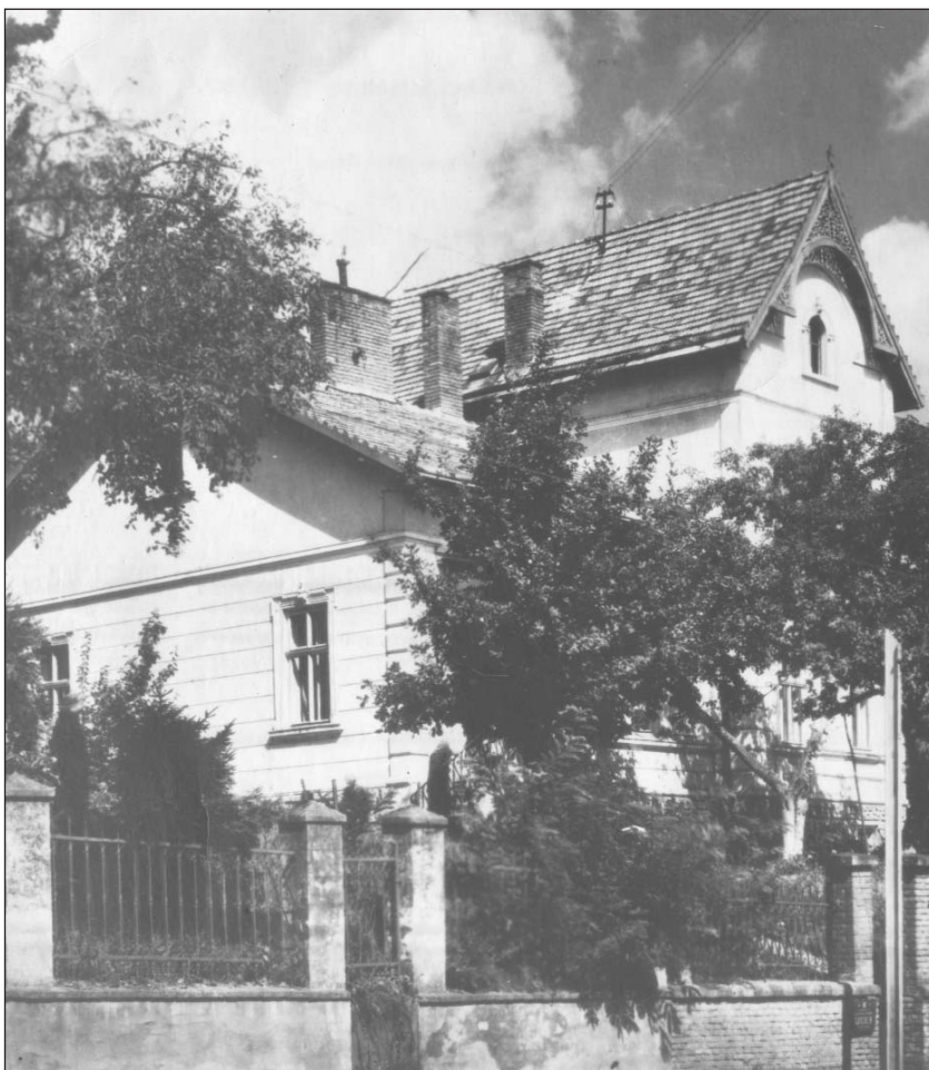
Львівський державний літературно-меморіальний музей Івана Франка

"Скрізь і завсігди у мене була одна провідна думка — служити інтересам мого рідного народу та загальнолюдським поступовим, гуманним ідеям. Тим двом провідним зорям я, здається, не спроневірився досі ніколи і не спроневірюся, доки мого життя" .