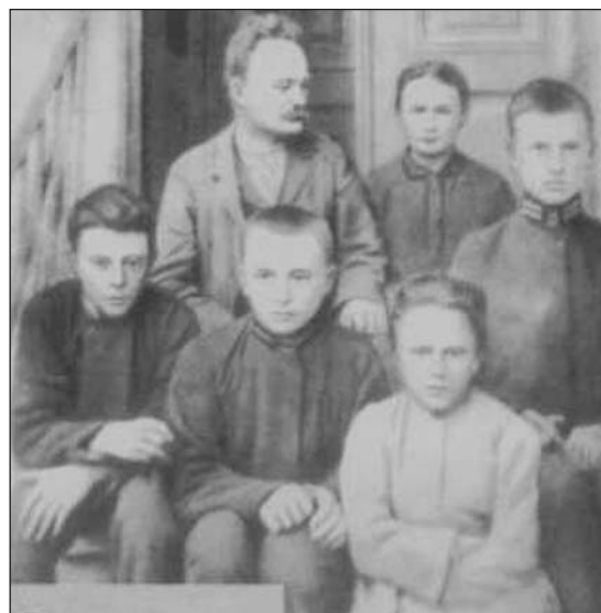
Іван Франко з дружиною Ольгою та дітьми Андрієм, Тарасом, Петром і Ганною. Львів, 1904 р.

У 1893 р. у Віденському університеті І. Франко захистив докторську дисертацію на тему: "Варлаам і Йоасаф. Старохристиянський духовний роман і його літературна історія", однак до викладацької роботи у Львівському університеті допущений не був. Саме в той час він пише сатиричні поеми "Ботокуди" (1893), "Абу-Касимові капці" (1895), найкращі свої драматичні твори — драму "Украдене щастя" (1894), романтичну драму-казку "Сон князя Святослава" (1895), драму "Учитель" (1896).