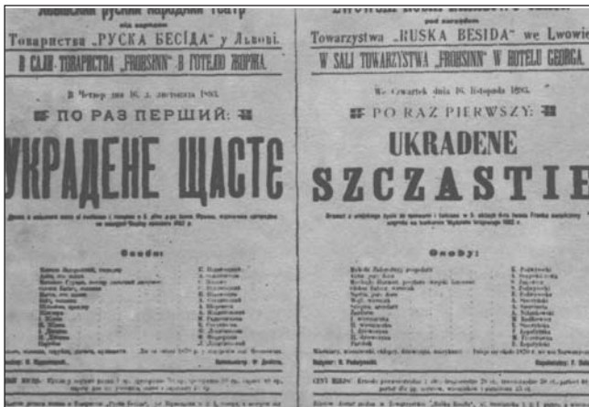
Афіша першої постановки драми "Украдене щастя". 1893 рік

Року 1902-го збудував власний будинок, у якому нині міститься меморіальний музей його імені, створений 10 жовтня 1940 р. У 1905 р. тут написав поему "Мойсей", через яку його стали називати українським Мойсеєм. Разом із поемами "Іван Вишенський" і "Похорон" ця поема стала вершиною української поезії.