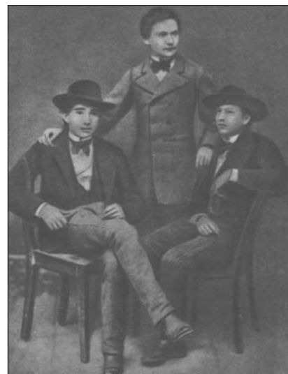
І. Франко з товаришами І. Погорецьким та Я. Рощкевичем. 1875 р.

Вдруге Іван Франко був заарештований 1880 р. по дорозі в Березів, куди поїхав як репетитор давати приватні лекції. Був відправлений етапом до Нагуєвичів, і цей етап ледь не коштував йому життя — він захворів на тиф. В цей період були створені його літературні шедеври: гімн "Вічний революціонер", оповідання "На дні", повість "Борислав сміється". Остання була надрукована в журналі "Світ", який І. Франко видавав разом зі своїм товаришем Іваном Белеєм 1881 року. За задумом І. Франка повість мала започаткувати в нашій літературі "ідеальний