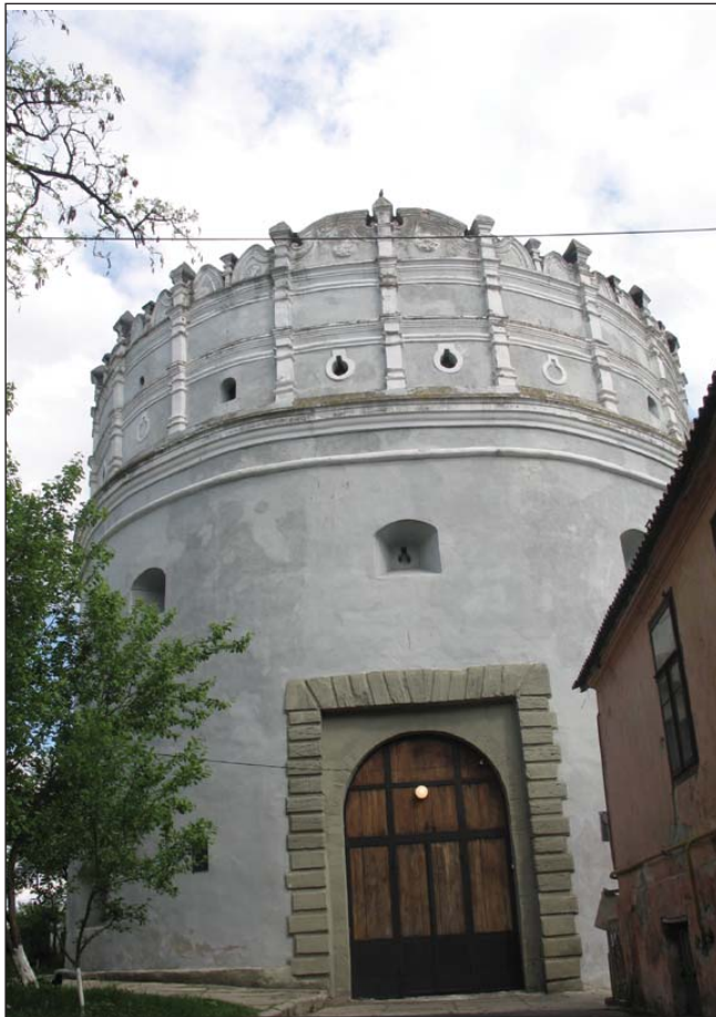
Луцька башта XVI-го століття в Острозі

філолог, письменник, єпископ Полоцький та Вітебський Мелетій Смотрицький ; ректор Києво-Могилянської академії Ігнатій Оксентович Старушич ; Київські митрополити Іов Борецький та Ісає Косинський ; найталановитіший письменник-полеміст XVII ст. Іван Вишенський .