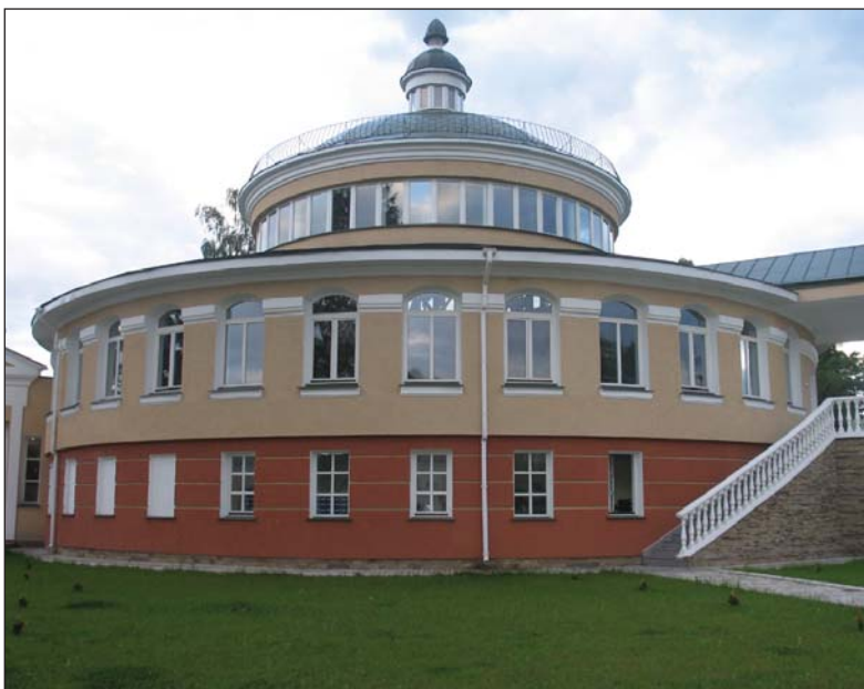
Приміщення нової бібліотеки Національного університету "Острозька академія"

Серед визначних учнів академії — гетьман Петро Конашевич Сагайдачний; архимандрит Києво-Печерської лаври Єлисей Плетенецький; визначний релігійний діяч, засновник скита Манявського Іов Княгиницький; видатний вчений,