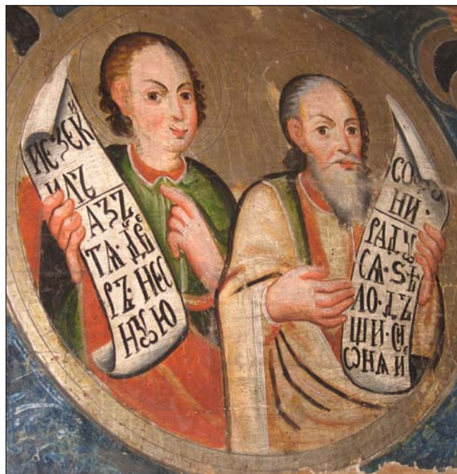
Картинна галерея музею Національного університету "Острозька академія"