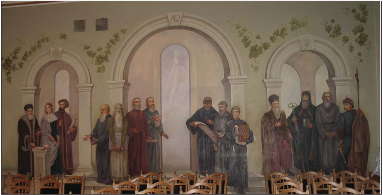
Конференц-зал Національного університету "Острозька академія"

котеджів для професури академії; у 2006 р. завершилось будівництво нового приміщення Наукової бібліотеки.