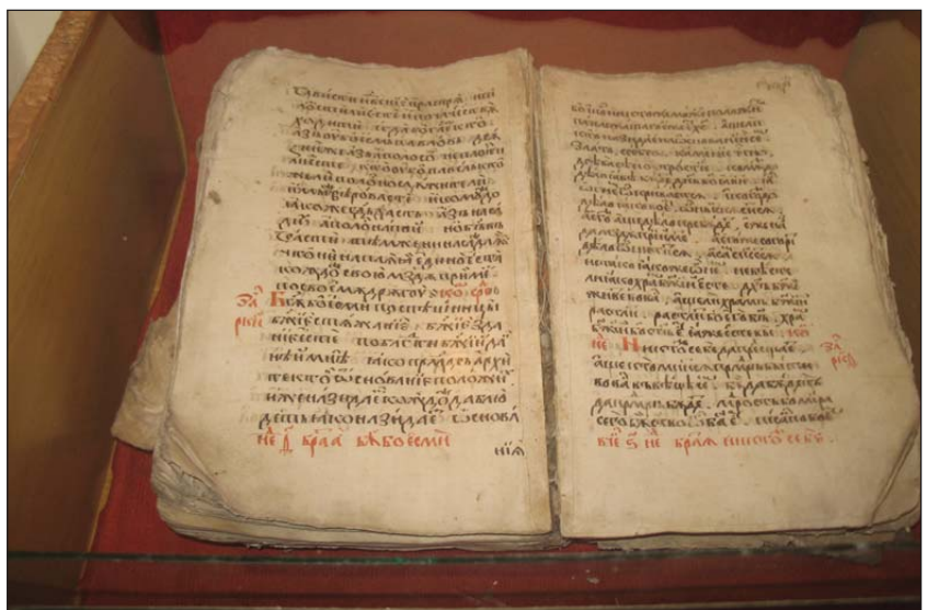
Рукописне Євангеліє початку XVII-го століття. Збірка стародруків і рукописів Острозької академії

У середніх класах Острозької академії вивчалися так звані "7 вільних наук", які складали середню освіту того часу. Це предмети тривіуму (граматика, риторика, діалектика) і квадрівіуму (геометрія, арифметика, астрономія і музика). Доказом вивчення діалектики в Острозькій академії є те, що до вищезгаданої "Грамматики словенска языка...", підготовленої острозькими