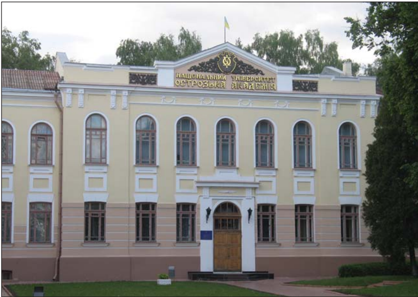
Національний університет "Острозька академія"

"Буквар" Івана Федорова, що вийшли з стін Острозької академії 18 червня 1578 р., стали головним чинником визначення часу її відкриття. На думку Я. Д. Ісаєвича, на середину 1578 р. вже було налагоджено діяльність академії та друкарні (побудовано приміщення, залучено кадри викладачів, літераторів, видавців). Отже, виходячи з того, що на виконання такого обсягу робіт потрібно було рік—півтора, можна віднести заснування обох інституцій "вже на 1576 — 1577рр." [3].