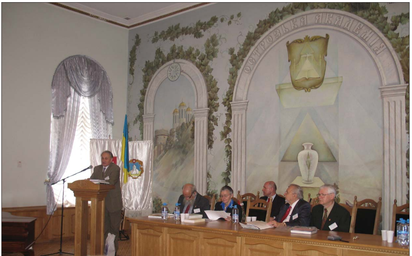
Під час відкриття Другої Міжнародної конференції “Українська діаспора. Проблеми дослідження” (Національний університет “Острозька академія”, 21 — 23 травня 2006 р.).

У 2001 р. до 425-річчя Острозької академії було збудовано містечко — 14 комфортабельних