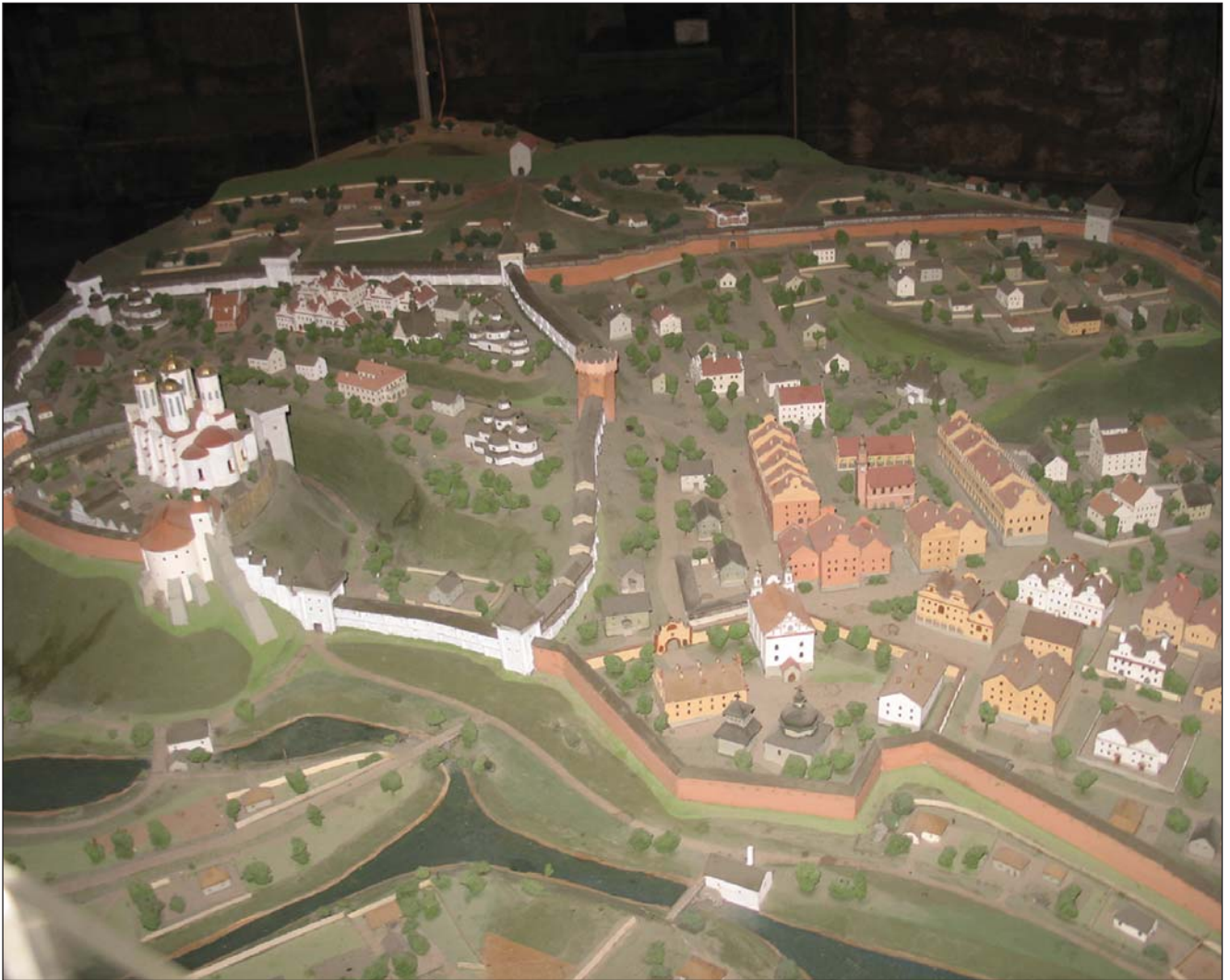
Вид на Свято-Воскресенську церкву і Острозьку академію (макет стародавнього Острога з експозиції краєзнавчого музею)