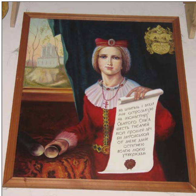
Портрет княжни Гальськи Острозької з дарчою грамотою 1583 р. на Острозьку академію

"Апокрисис албо отповедь на книжки о соборе берестейском" Христофора Філалета (1598—1599), збірник "Книжиця в 10 розділах", десятим розділом якої було послання видатного українського письменника-полеміста Івана Вишенського "Благочестивому господарю Василю, княжати Острозкому, а всем православным христіанам Малое Россіи... от святое афонское горы скитствующих" (1598), вищезгадані "Отпись на листъ... Ипатія Володимирскаго і Берестейскаго епископа..." (1598) та відповідь "На другий лист Ипатія епископа до... княжати Константина..." (1599), написані невідомим спудеєм, що назвав себе "Кліриком Острозким".