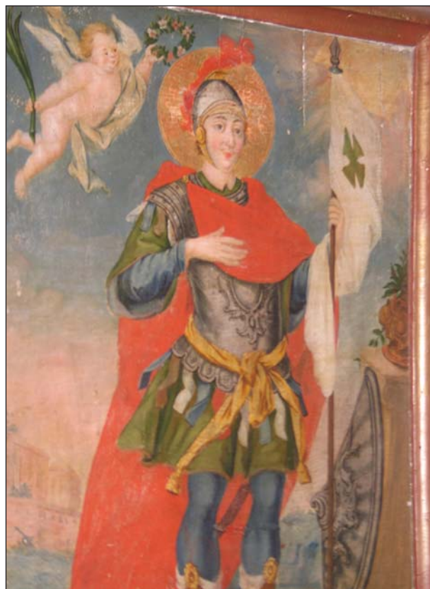
Ікона "Святий Дмитрій" XVIII століття. Збірка іконопису Острозької академії

У найтяжчий період для православної церкви, коли готувалася і була прийнята Берестейська унія, в Острозькій академії були створені та надруковані такі шедеври полемічної літератури, як "Ключ царства небесного" Г. Смотрицького (1587), "Книга о единой истинной православной вере" В. Суразького (1588), "Извещение краткое о латинских прелестях" І. Княгиницького (?) (1593),