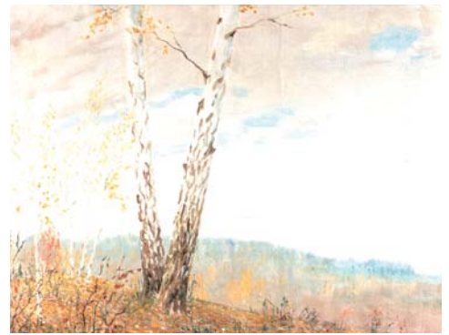
О. К. Антонов “Березки”